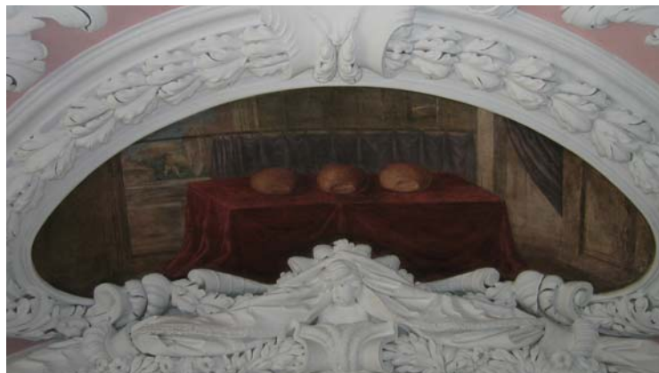
Tisch mit Schaubrotten (Ex 25,30)