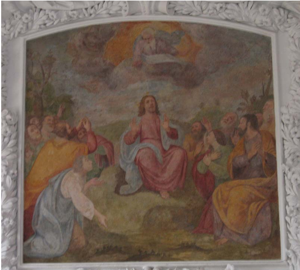
Jesus lehrt in der Bergpredigt das Vater-unser mit der Brotbitte (Mt 6, 9-13)