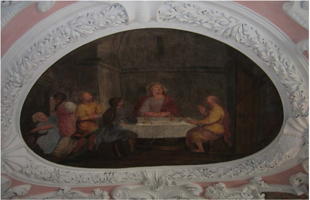
Emmausjünger Lk 24,13 ff