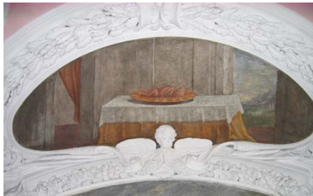
Brandopferaltar mit Opfertier in der Schale (Ex 27,3)