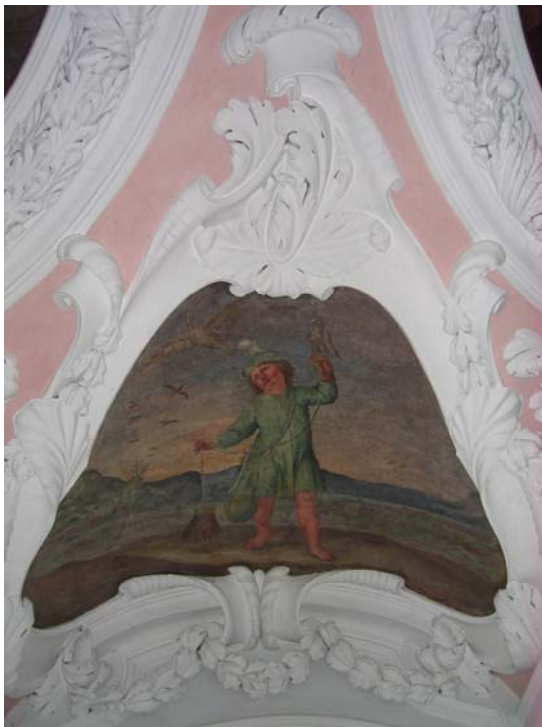
Jagen – Falknerei