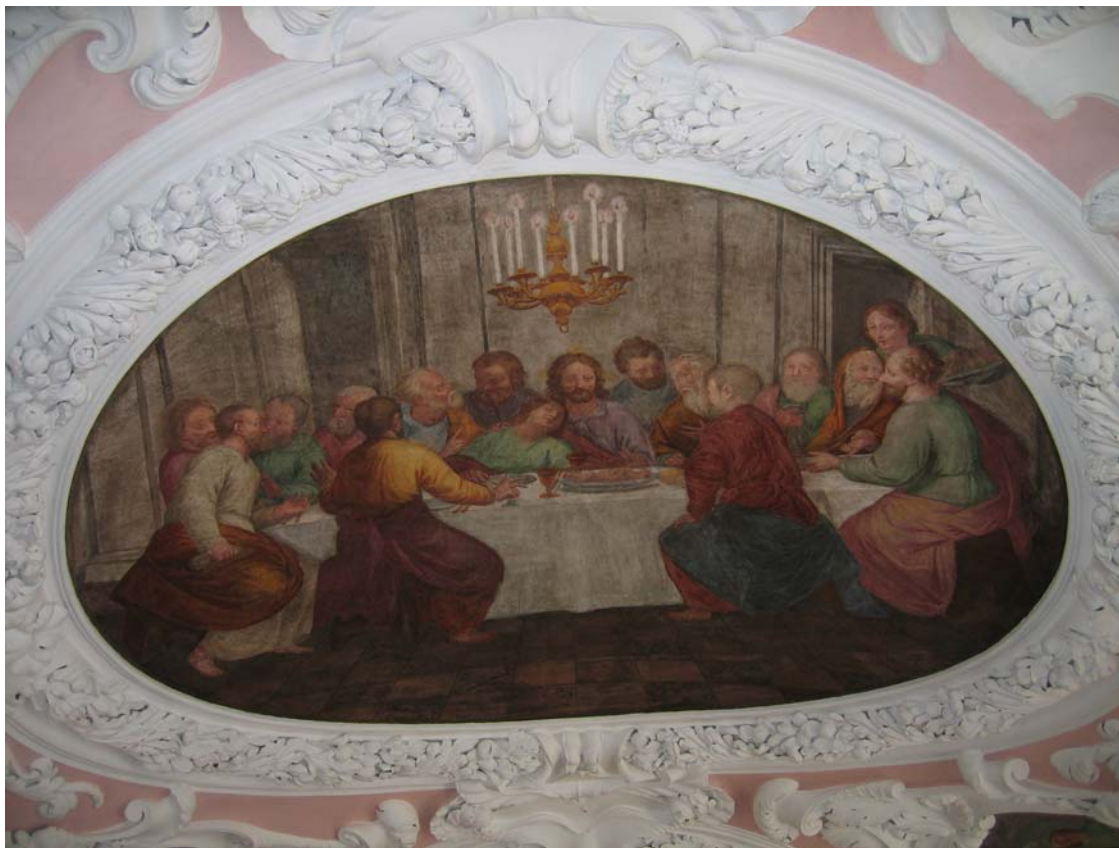
Letztes Abendmahl Mt 26,20 ff