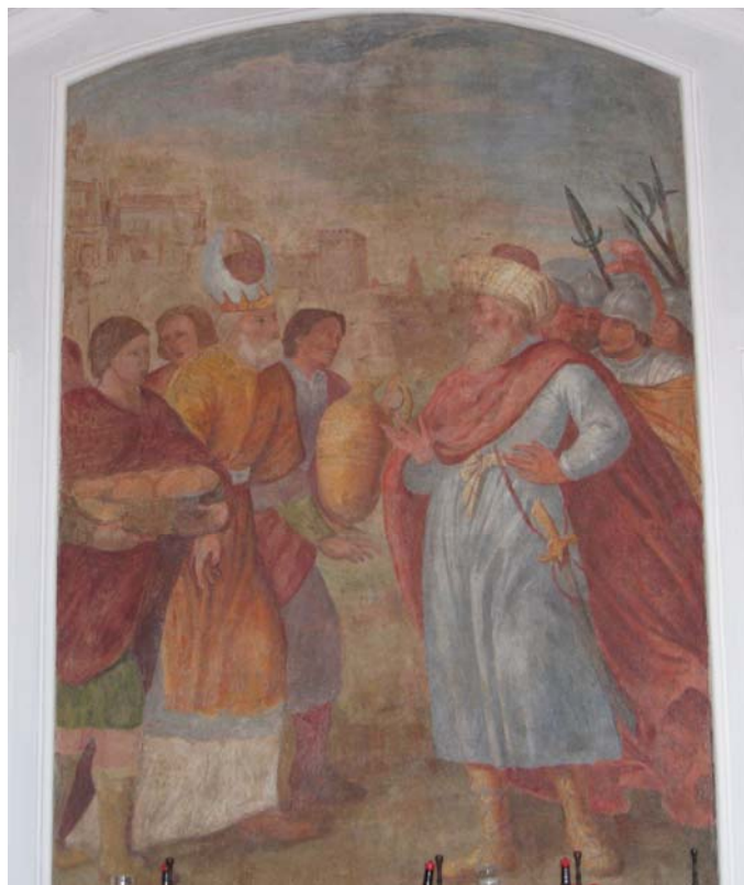
Melchisedek bringt Abraham Brot und Wein (Gen. 14,18)