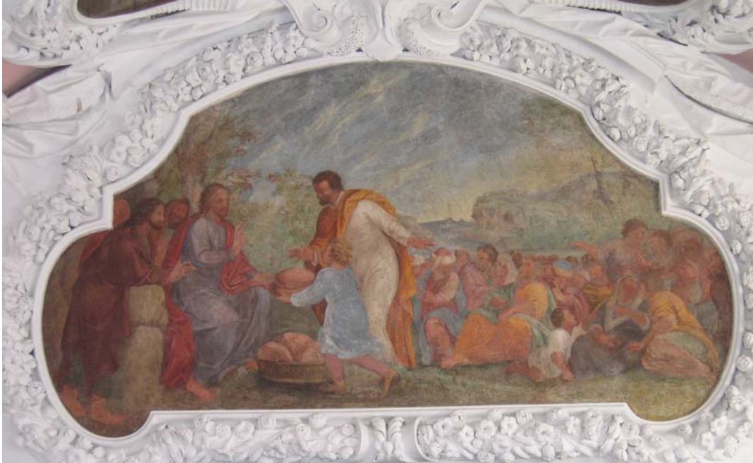
Brotvermehrung Mt 15, 32 ff