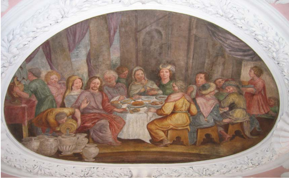
Hochzeit zu Kana Joh 2,1 ff