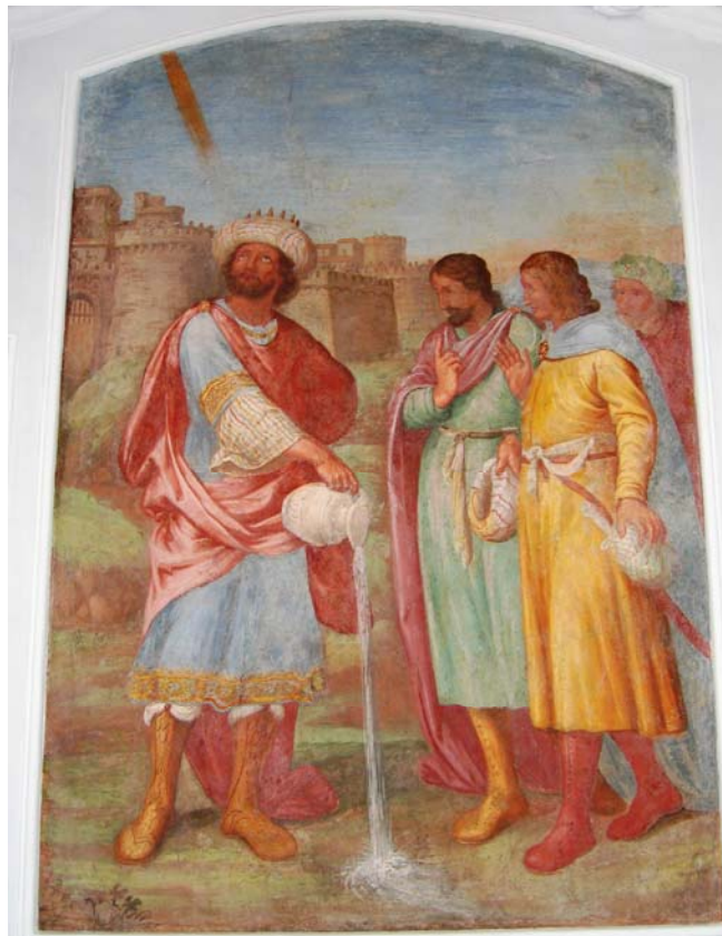
David will nicht den Durst löschen, während die anderen dürsten (2 Sam 23,15)