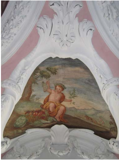
Früchte und Ackerbau