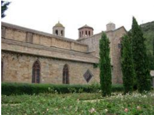
Vue extérieure de l'Abbaye avec sa Roseraie

Fontfroide offre depuis quelques années une nouvelle roseraie. Sur cet emplacement, au sud de l'abbaye, subsista durant de long siècles le double enclos d'un cimetière. Dans la partie orientale jouxtant le transept de l'église, étaient enterrés les religieux, moines et convers. Depuis le XIIe siècle, plus de deux mille sépultures se sont superposées.