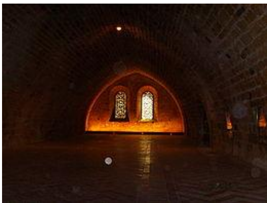
Le dortoir des frères convers

Il fut construit au-dessus de la salle capitulaire au début du XIIIe siècle. À l'Ouest, huit ouvertures durent être occultées aux deux tiers vers 1250 quand les galeries du cloître furent surélevées pour faire place aux voûtes d'ogives. Lorsque, en 1910, le dortoir fut aménagé en salle de musique, il fallut masquer ces disgracieux rehaussements de pierre. Les propriétaires installèrent des vitraux de papier. Sur le mur du nord une grande fresque de la