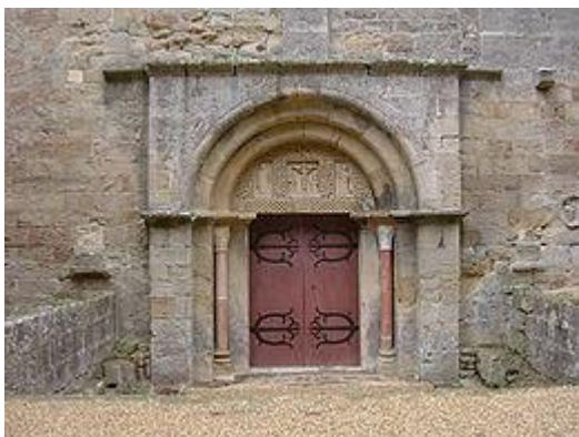
La porte romane d'entrée du Cellier

La porte servait d'entrée principale au monastère. Un arc, vide de tout ornement, dessine un plein cintre. Les claveaux, finement taillés, épanouissent leur éventail en longues lignes trapézoïdales. Un imposant linteau constitué d'un unique bloc, soutient le tympan.