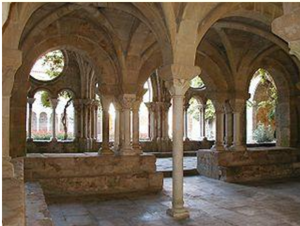
Fontfroide -- Le cloître vu de la salle du chapitre

Dans la seconde moitié du XII e siècle, quand Fontfroide, riche de multiples donations, entame le temps de sa plus grande prospérité, un important remaniement est réalisé suivant le goût et les techniques nouvelles, celles de l'âge gothique. Dans chaque travée, les colonnettes romanes, toujours en place, sont désormais surmontées d'un haut tympan, percé d'oculi différemment répartis et qui s'inscrit lui-même dans un profond arc brisé. L'ancienne couverture de bois est remplacée par la pierre et, à l'intérieur des galeries, les voûtes d'ogives retombent le long des murs sur d'élégants culots, à deux mètres du sol. Il faut encore parcourir la galerie sud pour atteindre le portail donnant accès à l'église abbatiale.