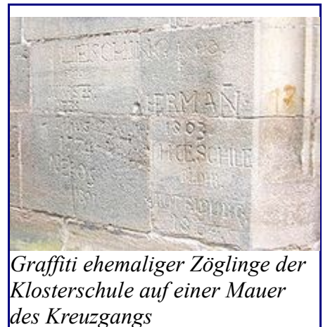
Graffiti ehemaliger Zöglinge der Klosterschule auf einer Mauer des Kreuzgangs