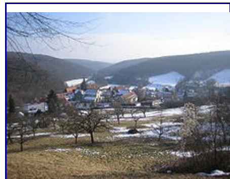
Das Kloster in Bebenhausen von Norden aus gesehen