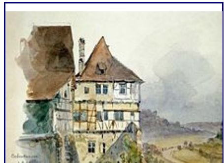
Kloster Bebenhausen am 3. Oktober 1854 - Aquarell von General Eduard von Kallee