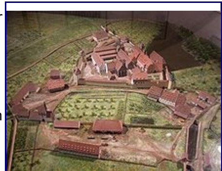
Kloster Bebenhausen (Architekturmodell)