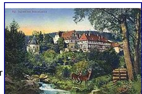
Jagdschloss Bebenhausen um 1900