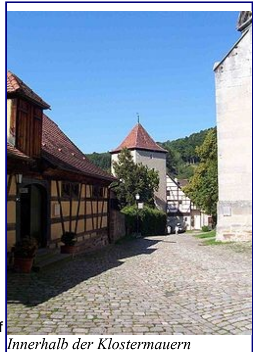
Innerhalb der Klostermauern

(Kloster) Bebenhausen liegt nördlich von Tübingen, am Südhang des Brombergs auf einem seit dem Mittelalter künstlich erweiterten Plateau oberhalb der Talsohle zweier dort zusammenfließender Bäche, an einer Fernstraße von den Alpen zum Rheintal, am Rande des Schönbuchs, des großen mittelalterlichen Reichswaldes. Das Grundwort des Ortsnamens -hausen mag auf die Alemannen und damit auf das 8./9. Jahrhundert zurückgehen, das Bestimmungswort Bebo- auf einen Mann dieses Namens, der sagenhafter Überlieferung zufolge je nachdem Herzog, Mönch oder Einsiedler gewesen sein soll. Archäologische Spuren, z.B. ein Friedhof, führen aber in der Tat ins frühe Mittelalter. Auch die Existenz einer Pfarrkirche als Dorfkirche verweist auf die vorklösterliche Zeit. Vielleicht gelangte Bebenhausen 1046 oder 1057 durch königliche Schenkung an die Speyrer Bischofskirche. Zudem wurde auf dem Südhang des Brombergs und damit in exponierter Lage ein Herrenhof der Tübinger Pfalzgrafen entdeckt, der Ausgangspunkt des Klosters Bebenhausen war.