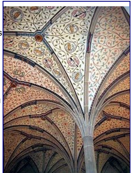
Deckengewölbe des Sommerrefektoriums